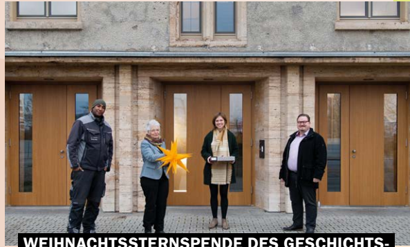
WEIHNACHTSSTERNSPENDE DES GESCHICHTS- WERKSTATT KÄFERTAL E. V. AN DIE MWSP