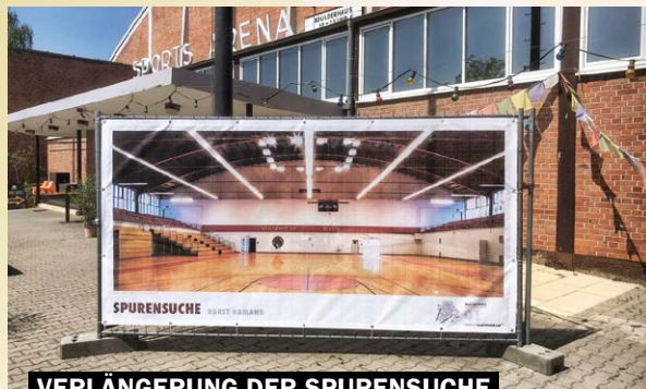
VERLÄNGERUNG DER SPURENSUCHE BIS ZUM 26.03.2021