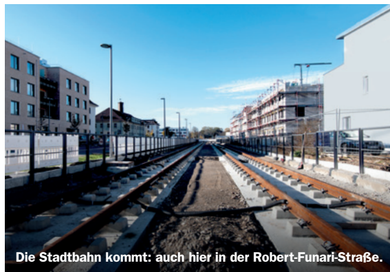
Die Stadtbahn kommt: auch hier in der Robert-Funari-Straße.

sein neues Domizil auf Sullivan: Auf dem Gelände der ehemaligen Ringerhalle in unmittelbarer Nähe zum Käfertaler Wald sind zwei Jurten mit überdachtem Außenbereich entstanden: In diesen können nun zwei Gruppen – das entspricht einer Verdoppelung der bisherigen Betreuungskapazität – des Wald- und Naturkindergartens das „Basislager“ für ihre Tagesaktivitäten aufschlagen. Little Franklin war der erste Kindergarten überhaupt auf FRANKLIN und ist nun auch der erste Jurtenkindergarten in ganz Mannheim. Einmal Pionier, immer Pionier, könnte man sagen. ■