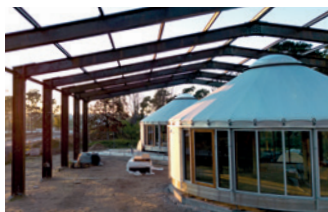
Die beiden Jurten von Little Franklin auf Sullivan.