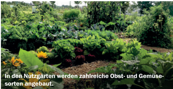
In den Nutzgärten werden zahlreiche Obst- und Gemüsesorten angebaut.

Eine Fachjury hat entschieden, wer die neuen Spielplätze am Teufelsberg und an der Stadtdüne sowie das Spielangebot am Kiefernain bauen wird. Bei der Sitzung Anfang März konnte das Spielraumlabor mit seinem Entwurf für den Teufelsberg überzeugen. Hier entsteht ein Spielplatz für Kinder ab ca. 6 Jahren. Die Firma KuKuk hat sich den Zuschlag für die Stadtdüne sowie das Spielangebot entlang des Weges am Kiefernain gesichert. Beide Spielstätten sind für jüngere Kinder gedacht. Die Sieger-Entwürfe waren eine Woche lang im HOUSE of MÆMORIES zu sehen. Die beiden Spielplätze sowie das Spielangebot sollen bis Dezember 2023 fertiggestellt werden. ■